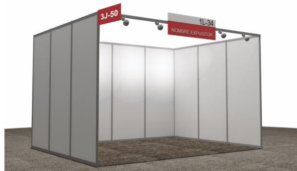
Ejemplo: Stand 12m2 Stand básico